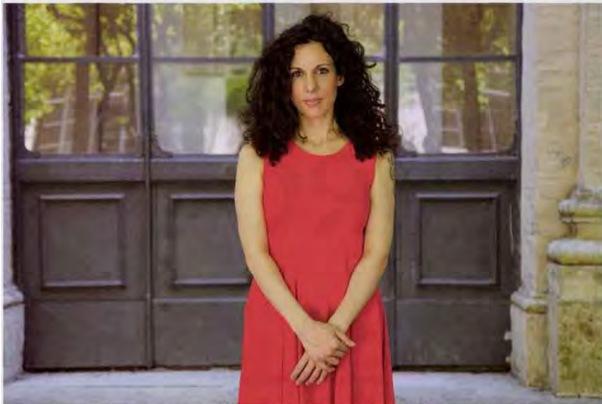
Le premier roman de Silvia Avallone, D'acier , paru en Italie en 2010, s'est vendu à près de cinq cent mille exemplaires.