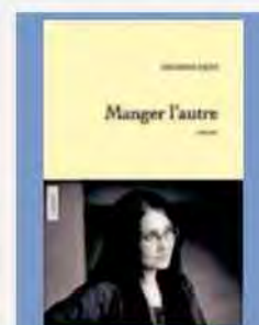
Manger l'autre Ananda Devi