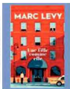
Une fille comme elle Marc Lévy

Une fille comme elle , de Marc Lévy, aux éditions Robert Laffont/Versilio La jeune fille et la nuit , de Guillaume Musso, aux éditions Calmann Lévy Chanson douce , de Leïla Slimani, aux éditions Folio