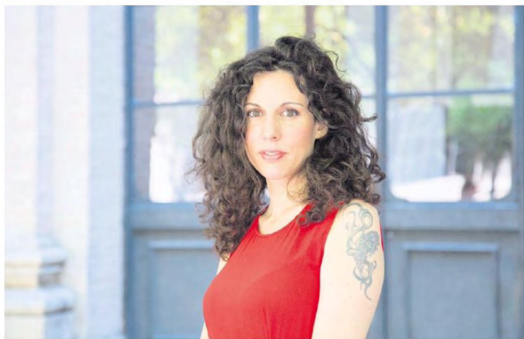
Silvia Avallone fait la part belle à l'oralité. Son écriture reflète « les mots des gens en lutte avec la réalité ».