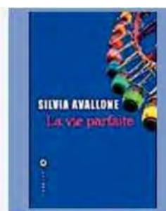
La vie parfaite Silvia Avallone