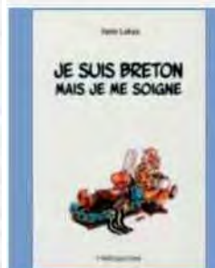
Je suis Breton mais je me soigne Yann Lukas

Je suis Breton mais je me soigne de Yann Lukas, aux éditions HélioPole. Où va la Bretagne ? de Yves Lebahy, aux éditions Skol Vreizh Ar bed all : la sorcière de Guerlédan de Yann Tatibouët, aux éditions Beluga