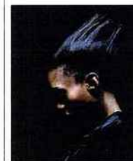
Jean-Paul Dubois Le cas Sneijder